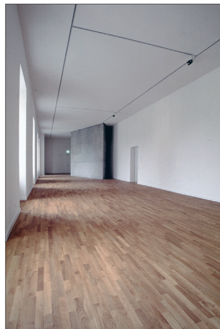
Паркет из дуба пропитанный IRSA Natura Hartöl. Еврейский музей Берлин

или лакам с высоким содержанием растворителя. Кроме того у промасленных или вощённых поверхностей, в отличие от лакированных, возможны частичные исправления. Для того чтобы Ваш паркетный-, пробковый- или деревянный пол оставался длительное время красивым, необходимо уделять большое внимание правильному уходу и очистке. Ценные советы по уходу Вы сможете по-