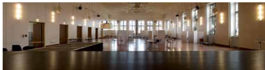
IRSA Bühnenlack, Gürzenich, Köln

Aussergewöhnliche Spezialitäten erfolgreich zu vermarkten, heisst erfolgreich die Bedürfnisse seiner Kunden zu kennen: ultramatte, schwarze Bühnen-Oberflächenschutzmittel, die sich zur Erstbehandlung und für Reparaturarbeiten eignen, leicht verarbeitbar sind und mit dem abgestimmten Reinigungsprodukt verlässlich gereinigt werden können - das sind die IRSA Produkte die ein durchdachtes Gesamtsystem für Bühnen bieten.