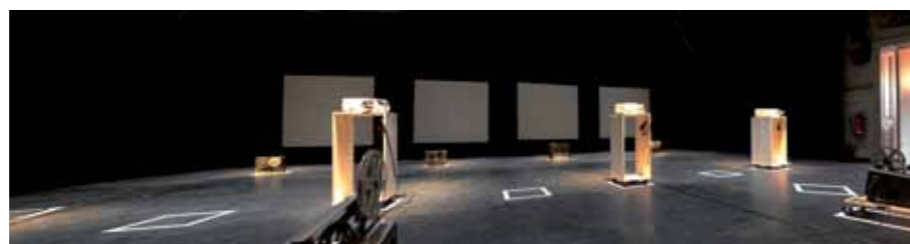
IRSA Bühnenlack, Theater „Pumpenhaus“, Münster