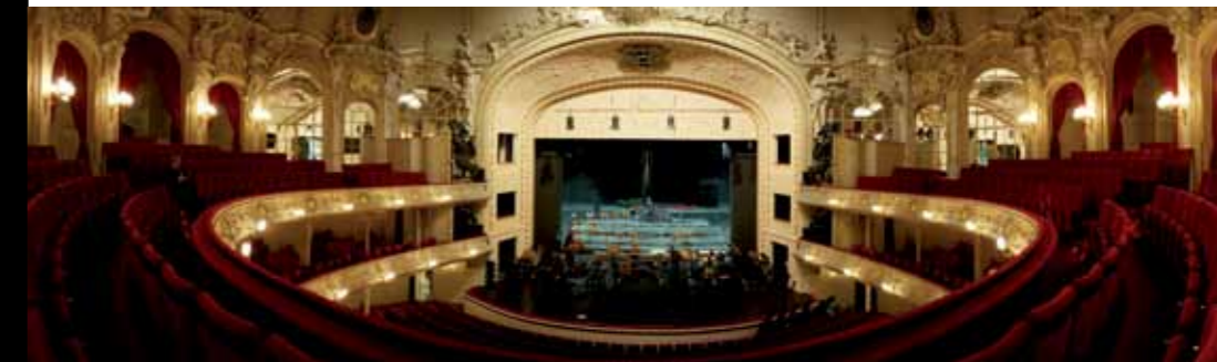
IRSA Bühnenlack, Komische Oper, Berlin

Zwei überzeugende Systeme für den Oberflächenschutz von Bühnen- oder Fotostudioböden: versiegeln oder ölen