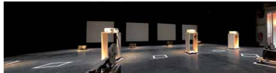
IRSA Bühnenlack, Theater „Pumpenhaus“, Münster