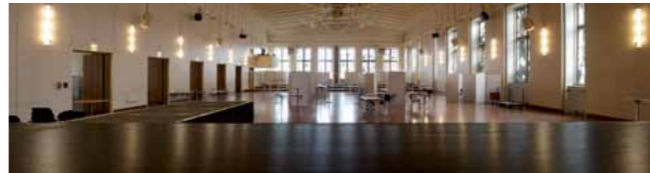
IRSA Bühnenlack, Gürzenich, Köln

Aussergewöhnliche Spezialitäten erfolgreich zu vermarkten, heisst erfolgreich die Bedürfnisse seiner Kunden zu kennen: ultramatte, schwarze Bühnen-Oberflächenschutzmittel, die sich zur Erstbehandlung und für Reparaturarbeiten eignen, leicht verarbeitbar sind und mit dem abgestimmten Reinigungsprodukt verlässlich gereinigt werden können - das sind die IRSA Produkte die ein durchdachtes Gesamtsystem für Bühnen bieten.